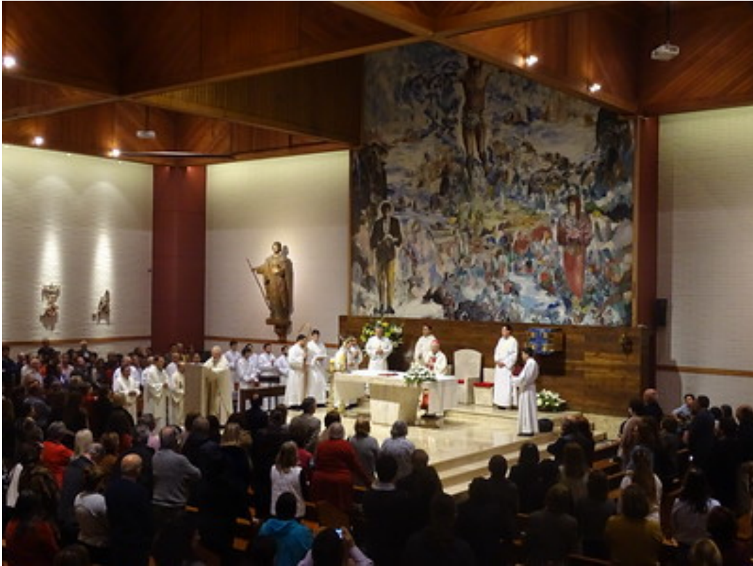
Aniversario Parroquial 2019